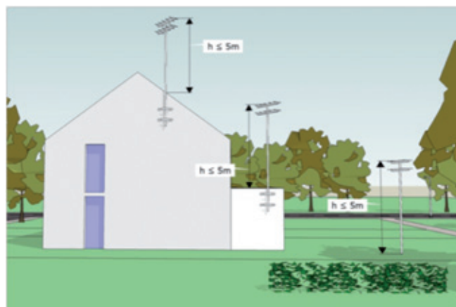
In bovenstaande afbeelding is aangegeven hoe de hoogte bepaald moet worden